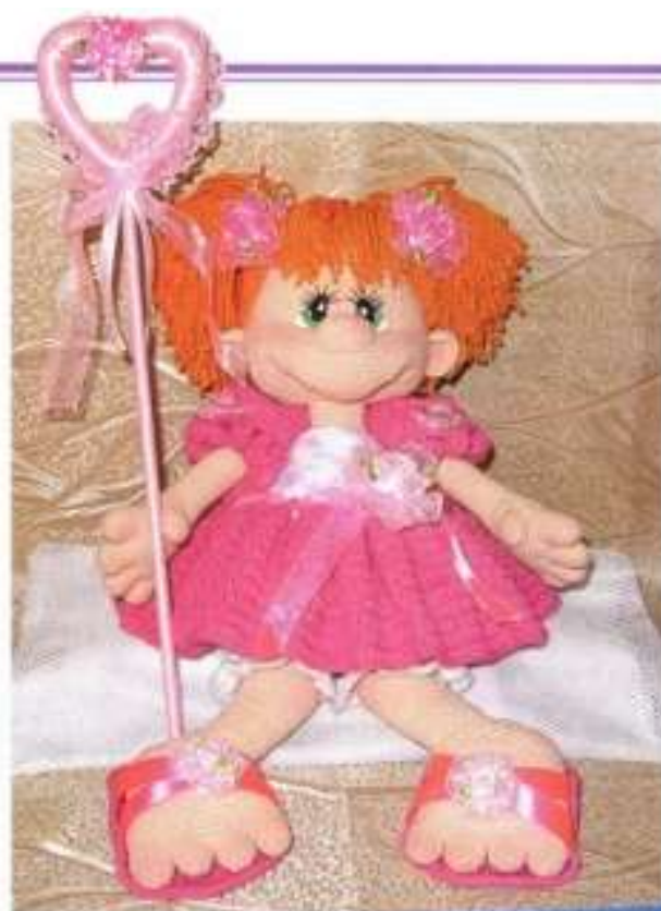
Изгибка придется по душе и взрослому, и ребенку. Цвет волос, причёску, наряд и аксессуары вы выбираете сами.

Условные обозначения ● = 1 возд. п. ↑ = 1 ст. с/н